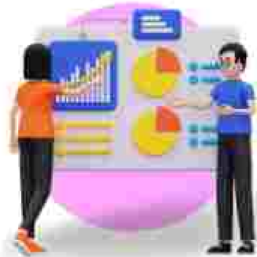
ODP GENERAL BANKING