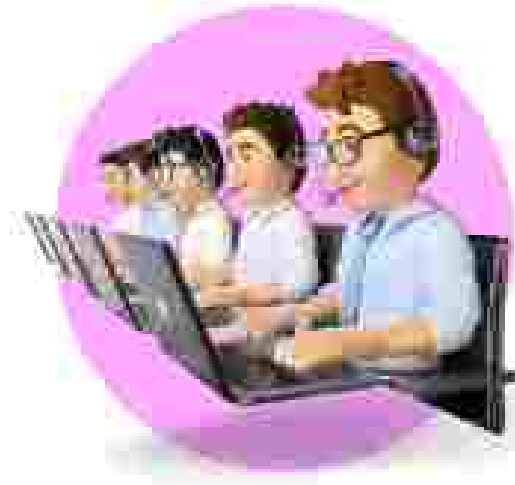
ODP DATA ANALYTIC