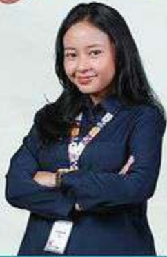
Manda (ASIX Gen-II) Universitas Airlangga

"Di program ASIX, aku belajar banyak hal seputar dunia kerja, culture perusahaan, tupoksi kerja, dan banyak lagi."