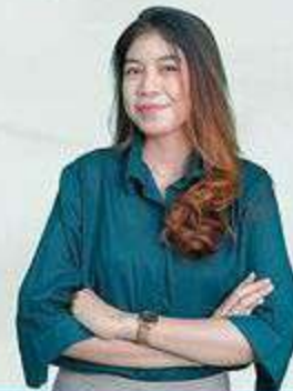
Ayala (ASIX Gen-I) STIE YAI Jakarta

"ASIX itu menjadi tempat untuk belajar, serta mendapatkan insight-insight yang sangat bermanfaat."